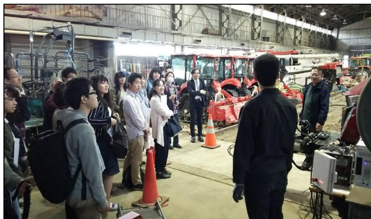
機器格納実験室で 無人トラクターや 収穫機器の説明を 聞く参加者 →