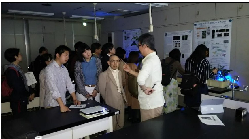
← ウィルスを光らせることでその感染状況を実際に見ることができることを確認している参加者