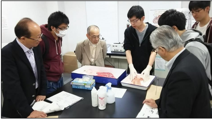
← 実際の牛の子宮を使って 人工授精の説明をする院生